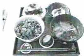
酵素玄米定食 (甘味付き) 800円

ドリンク……日本茶・コーヒー・紅茶・ミルクドリンク *寒い冬は、しょうが紅茶や甘酒で体を温めてください。