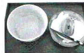
お抹茶 / ドリンク 600円