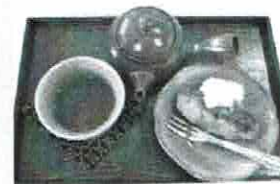
日本茶 / ドリンク 500円

程よい辛さがくせになる美味しいパスタです。ゆず胡椒とパスタのコラボは絶品です。一度食べたら病みつきになりますよ！