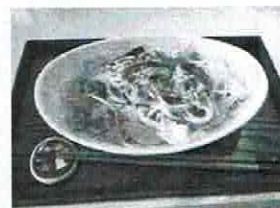
豚肉と彩り野菜の柚子こしょうパスタ / 和風パスタ 650円

鶏肉と季節の新鮮野菜を大きめにカットし生姜を効かせたやさしい味のスープに仕上げ、酵素玄米とあわせました。生姜がたまりません。体が温まりますように！